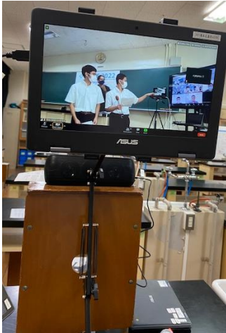
図2 各ポスターの前に設置した配信用端末セット