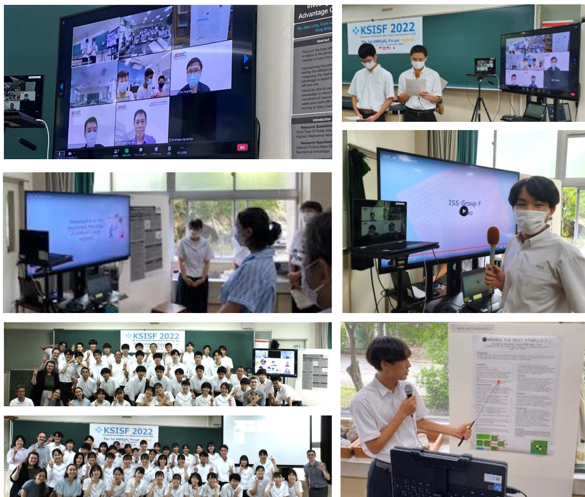
図1 KSISF2022の様子 ハイフレックス型ポスター発表会として実施

7月12日に、第1回目となる、本校主催の生徒国際科学フォーラムを開催しました。シンガポールのSSTがリアルタイムで参